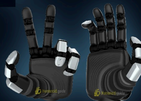
PaXini GMH15 — Multi-Dimensional Tactile Robotic Hand